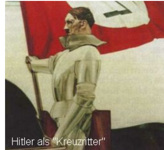
Hitler als "Kreuzritter"