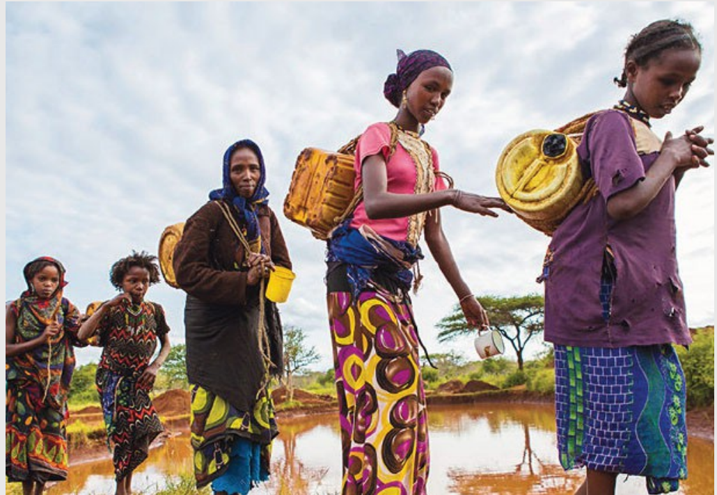
Donne etiopi in cerca di acqua potabile. L'Etiopia è il Paese con la minore disponibilità di acqua nel mondo.

L'acqua potrebbe così diventare causa di nuove guerre.