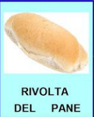
RIVOLTA DEL PANE