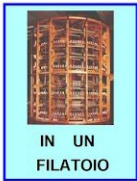
IN UN FILATOIO