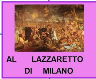
AL LAZZARETTO DI MILANO